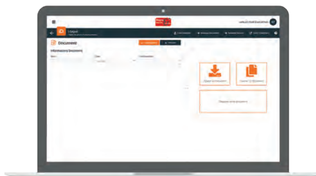
Aperçu de dépôt sur écran PC ou tablette